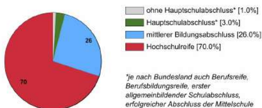
Ausbildungsanfänger/innen 2020 (in %)

Rechtlich ist keine bestimmte Schulbildung vorgeschrieben. In der Praxis stellen Betriebe überwiegend Auszubildende mit Hochschulreife ein.